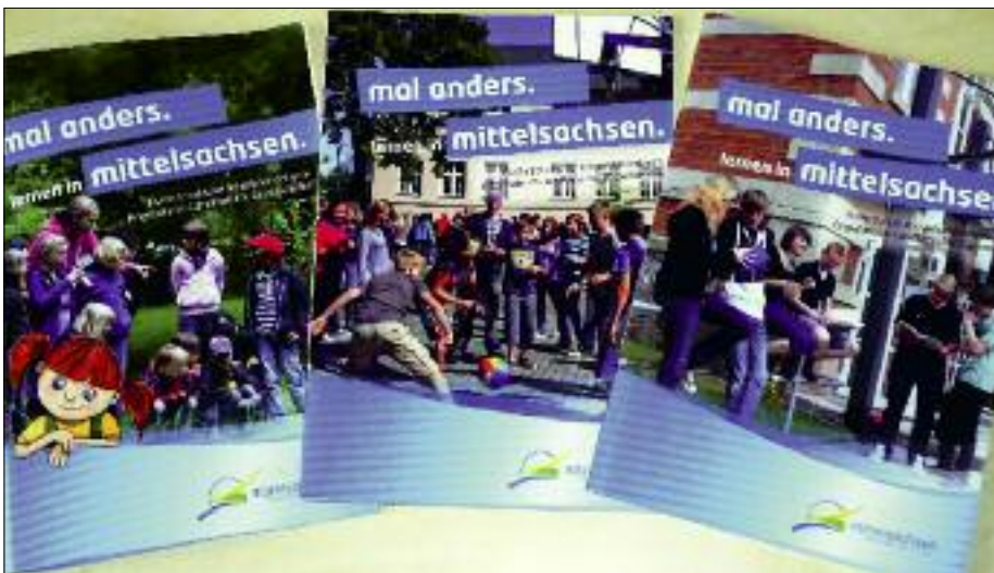
Broschüren um Thema „Mal anders lernen in Mittelsachsen“.

auf ein inklusionsgerechtes Angebot ist ein kleiner, aber wichtiger Schritt, damit jeder Mensch die Möglichkeit erhält, sich vollständig und gleichberechtigt an allen gesellschaftlichen Prozessen zu beteiligen – und zwar von Anfang an und unabhängig von individuellen Fähigkeiten, ethnischer wie sozialer Herkunft, Geschlecht oder Alter.