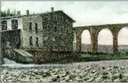
Die Ansichtskarte (Stempel: 21.4.1903) zeigt links den Anbau von 1898 (helle Fassade). Hinter den Erdgeschossfenstern dreht sich die hist. Turbine I. Im Obergeschoss befanden sich die Unterkünfte für die Kriegsgefangenen.