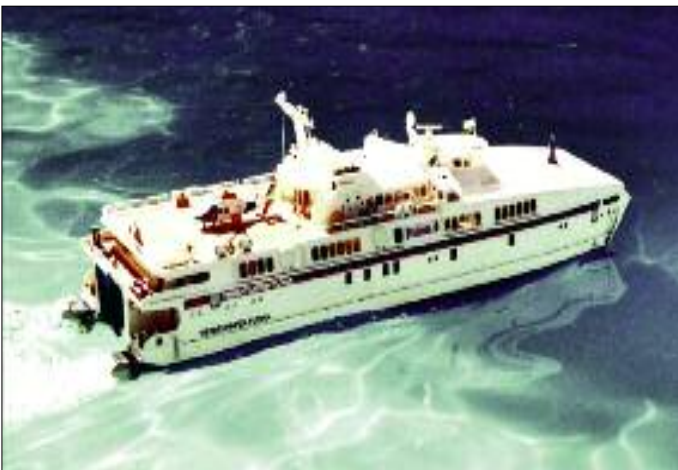
Für den Katamaran „Heimathafen Flöha“ wird das Falkenauer Bad zum Weltmeer.

D. Wildner Interessengemeinschaft Kultur- und Heimatpflege Falkenau