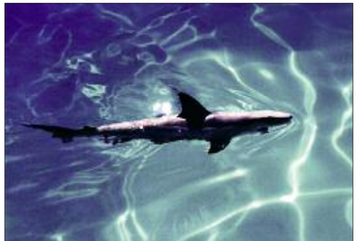
„Haifischalarm“ im Falkenauer Bad