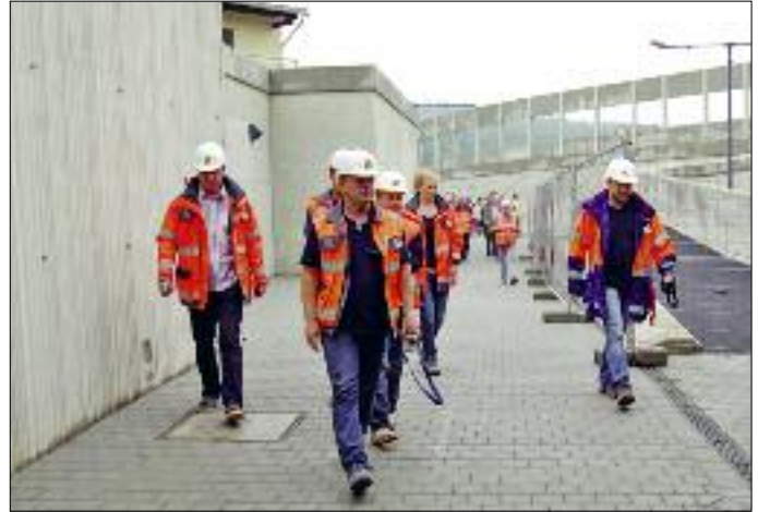
Die Silberöhre, wie wir sie noch kennen und rechts daneben der südliche Zugang am Tag der Eröffnung der neuen Silberöhre.