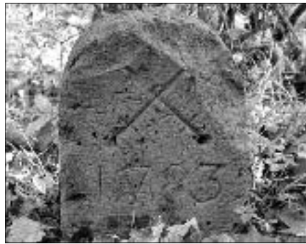
Auch schon vor mehreren hundert Jahren wurden Flurstücke eindeutig gekennzeichnet. Hier ein Königlich Sächsischer Grenzstein am Rande der Flöhaer Struth.

Damit Klarheit über die Flurstücke und den Verlauf der Flurstücksgrenzen besteht, wird seit der Uraufnahme in der Mitte des 19. Jahrhunderts in Sachsen