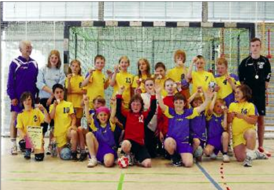
Der Jubel ist mehr als verständlich: Die gemischte E-Jugend des VfB Blau-Gelb Flöha wurde Handball-Kreismeister.