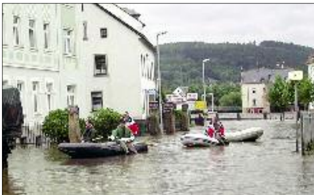
Land unter in Flöha. Ohne Boot war zum Hochwasser 2002 kein Vorwärtskommen.

In den vergangenen zehn Jahren hat sich in der Stadt viel getan. Die Häuser wurden saniert, Gärten attraktiv gestaltet und Straßenschäden beseitigt. Deshalb soll mit einer Fotodokumentation gezeigt werden, wie sich Flöha mit seinem Ortsteil Falkenau verändert hat. Der Gewerbe- und Festverein Flöha e.V. ruft zu einem Fotowettbewerb auf, an