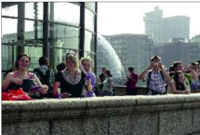
Ein Muss bei jedem Englandbesuch – Fototermin auf der Tower Bridge.

Informationen erhalten Sie im Internet unter www.gruene-schule-grenzenlos.de , per E-Mail unter ferien@gruene-schule-grenzenlos.de oder telefonisch unter 037320/8017-0.