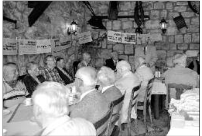
Der Verein für Stadtgeschichte feierte sein 20-jähriges Gründungsjubiläum in der „Bauernschänke zum Pomselberg“.

Der Geschichtsverein versteht sich als geschichtliches Gewissen der Stadt und unterbreitet gern auch Vorschläge. So beriet er auch die Stadträte zur Gestaltung des Stadtwappens oder stand auch einmal nicht sinnvoll erscheinenden Namensvorschläge kritisch gegenüber.