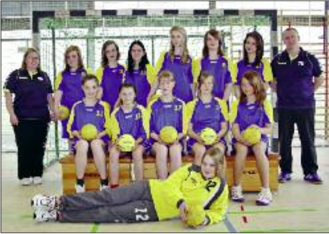
Die weibliche C-Jugend des VfB Flöha.