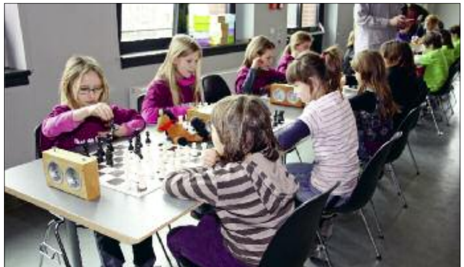
Beim Schach-Landesfinale der Grundschulen waren Mannschaften aus dem gesamten Freistaat in Flöha zu Gast.

Der Stadtsaal der Alten Baumwolle Flöha war am 15. März wieder einmal Schauplatz eines Schach-Großereignisses, denn an diesem Tag fand das Landesfi-