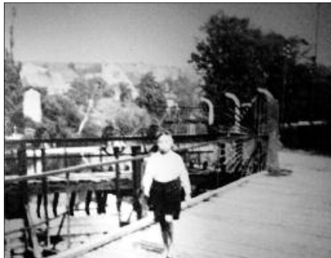
Die Ochsenbrücke führt über den Mühlgraben der Fa. Weber. Im Hintergrund das Wassereinlaufwerk des Mühlgrabens.

Nicht minder wissenswert wird sicher die geplante Vortragsveranstaltung „Rund um die Silberröhre“ werden. Die allseits bekannte und nun im Zuge der umfangreichen Bauarbeiten verfüllte Bahnunterführung steht im Mittelpunkt all dessen, was sich rundum im Laufe der Jahre in unserer Stadt veränderte und auch welche umfangreiche Bautätigkeit jetzt geschieht. Die Chronisten dokumentieren mit Bild und Text alles und werden im