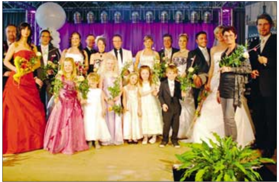
Modenschau team der Messe „Hochzeit & Feiern“