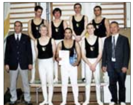
Beim Bühnenturnen mit dabei: die Männermannschaft, die in der vergangenen Saison den 2. Platz in der 2. Landesliga belegte

Mit einem Bühnenschauturnen, beginnt am Sonnabend, den 20. März 2010, 18:00 Uhr in der Turnhalle am Auenstadion das 10. Flöhaer Turnertreffen. Eine anschließende Abendveranstaltung mit Tanz- und Livemusik wird einige Überraschungen bieten.